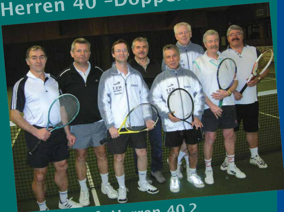
Mannschaft Herren 40.2